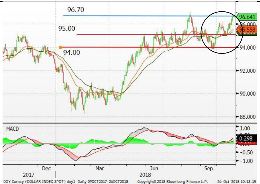
图 2：美元指数 -日线图：美元指数再次突破 96 的水平，并反覆走高。美元或有力上试近期 96.7 的高位。中短期内，该指数料在 95-96.7 内区间波动。