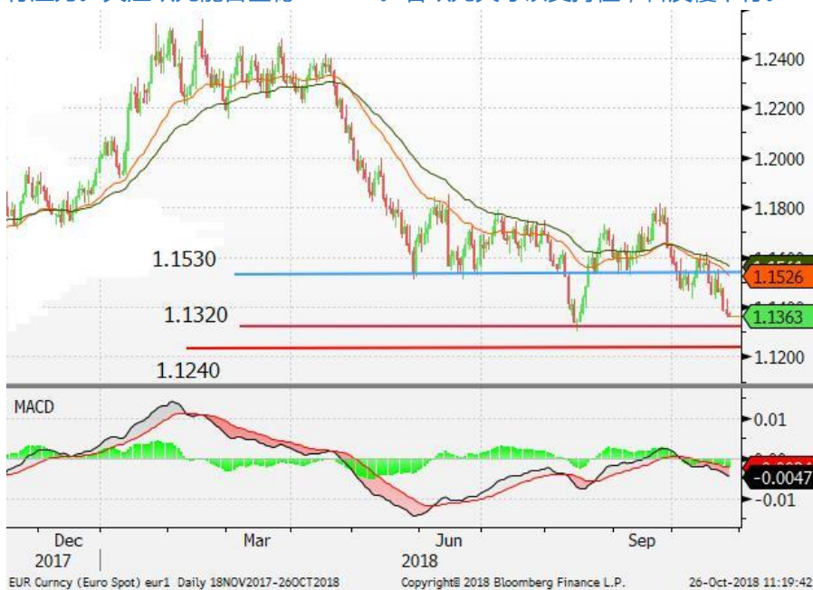
图 1：欧元/美元 - 日线图：欧元震荡走低。空方力量较强，欧元继续面临下行压力。关注欧元能否企稳 1.1320。若欧元失守该支持位，料反覆下行。