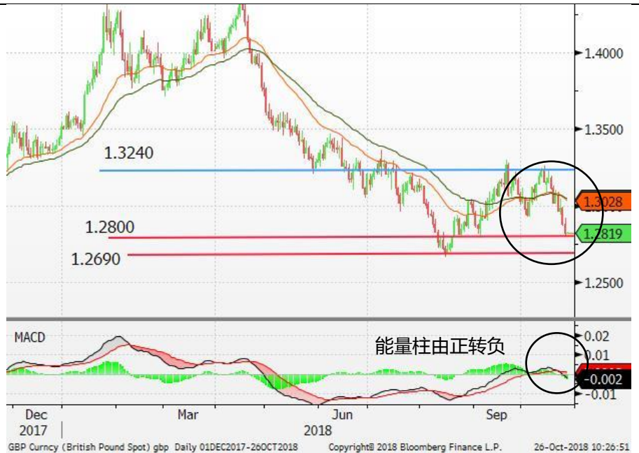
图 3：英镑/美元-日线图：英镑进一步跌穿 1.29 的支持位。能量柱由正转负，英镑料持续受压。1.2800 为近期重要的支持位。