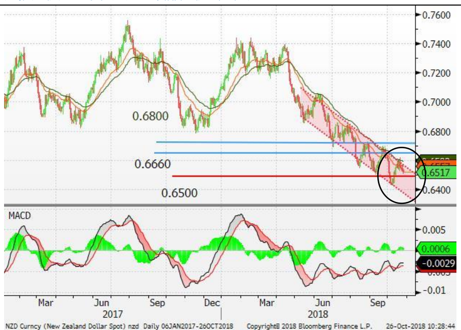
图 7：纽元/美元 - 日线图：纽元延续下行的走势。多方能量转弱，纽元的沽压依然较大。下行通道的顶部为较强的阻力。