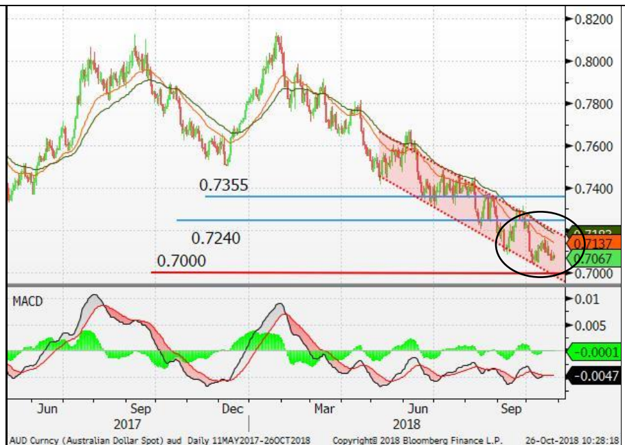
图 6：澳元/美元 - 日线图：澳元维持反覆下行的走势。短期内，澳元或难以完全扭转弱势。澳元/美元料在 0.7000 找到强劲的支持。